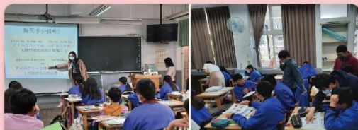
正德國中：初級日語課程