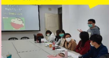
寒假模擬授課學習營

今年雖受到新冠肺炎影響，國中部的校園實習課程仍繼續進行，且透過最後一週之闖關活動讓學生能夠總複習五週以來所學基本旅遊日語。而小學部的課程則著重於加強對本土文化的了解外，能夠知曉其他國家與本土文化之差異，並能夠拓展國際視野及體驗其文化。