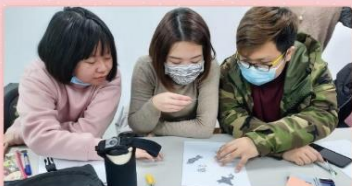
寒假模擬授課學習營：DIY 勞作體驗